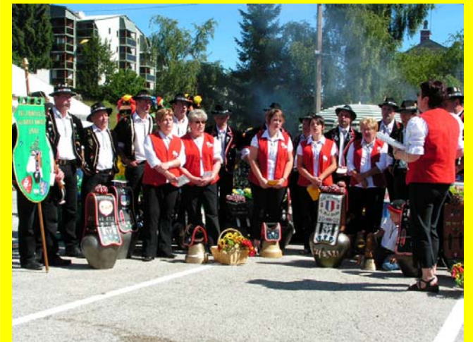
Tout le public les attendait ...