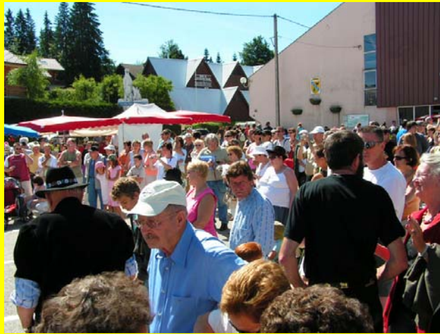
La foule !