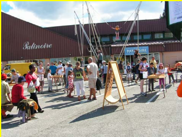
Les visiteurs s'essayer aux jeux en bois ...