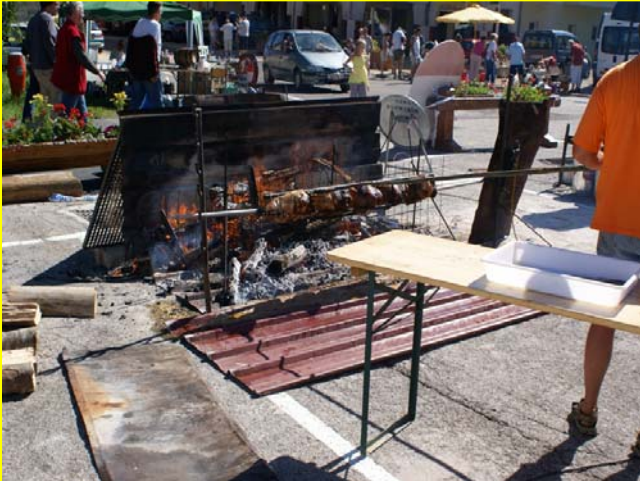
Hummm, les beaux jambons ....