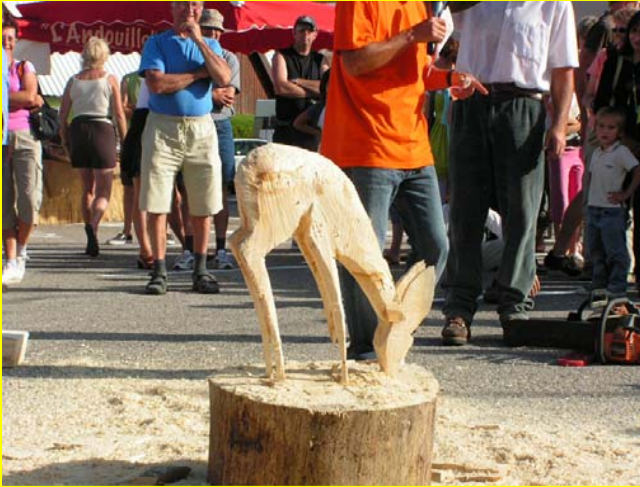
Oh ma biche !!!