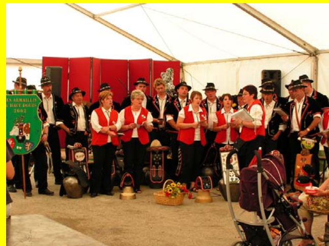
Et une petite dernière pour la route !

Pour la 1 ère édition de la fête de la Sambine, plus de 900 heures bénévoles du vendredi 08 au dimanche soir 10 août 2008 !