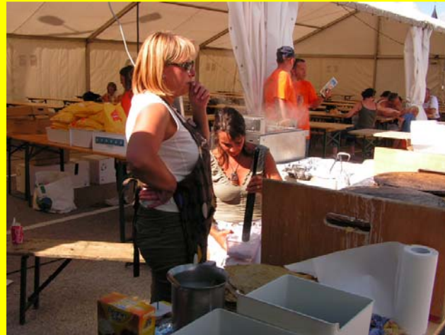
Pendant ce temps, les crêpes se préparent ...