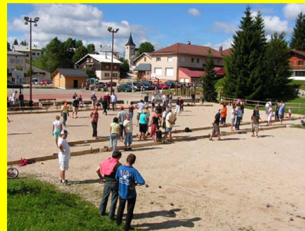
Vue d'ensemble du terrain