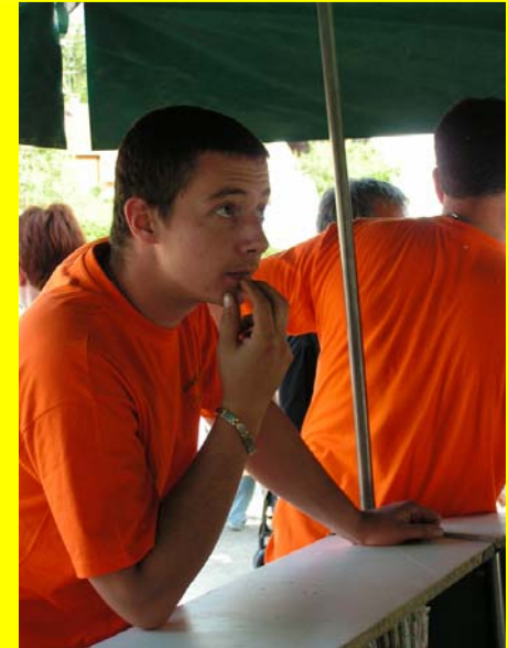
Je me suis fait étendre aux boules !!!