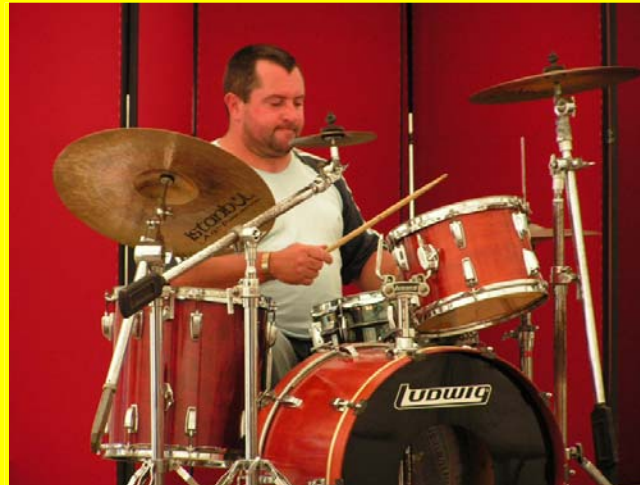
En méditation ...