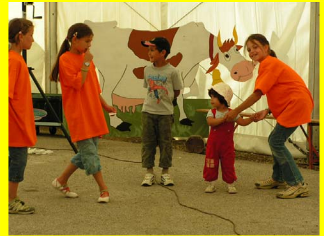
Les enfants s'échauffent pour le bal ...