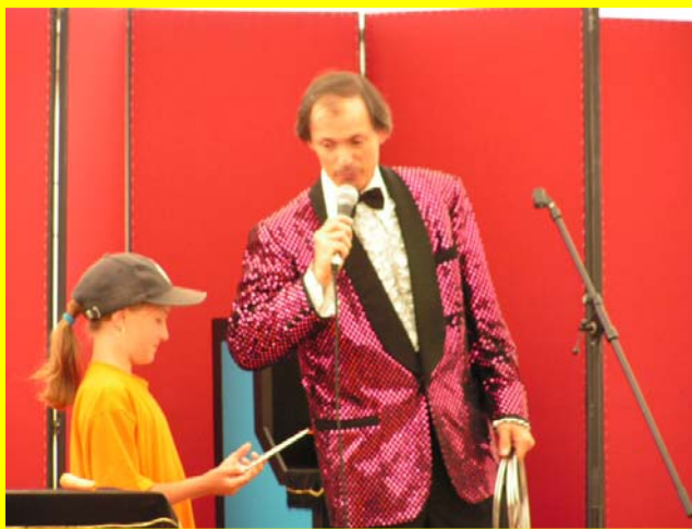
Comment ça s'accroche ton truc ??