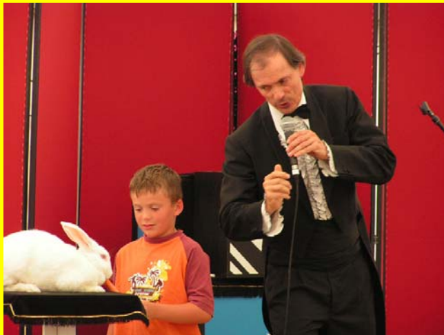
Lapin, lapin ...