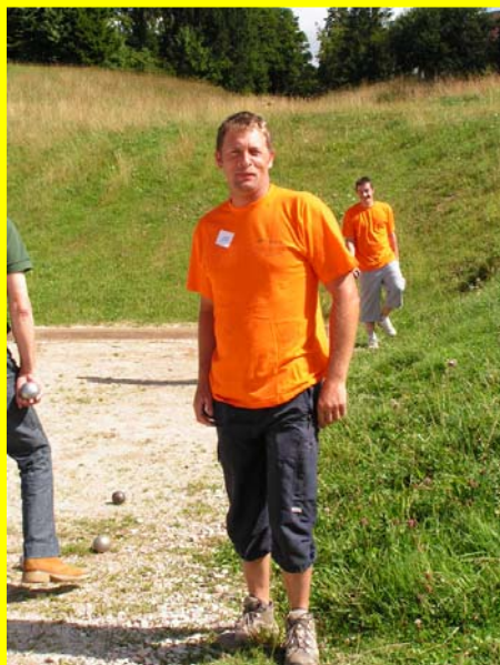
On voit ceux qui s'entraînent à l'année ...