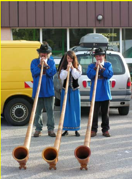
Un peu de cor des Alpes ...