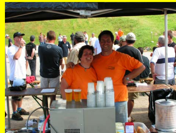
Samedi, le concours de pétanque, et la buvette ...