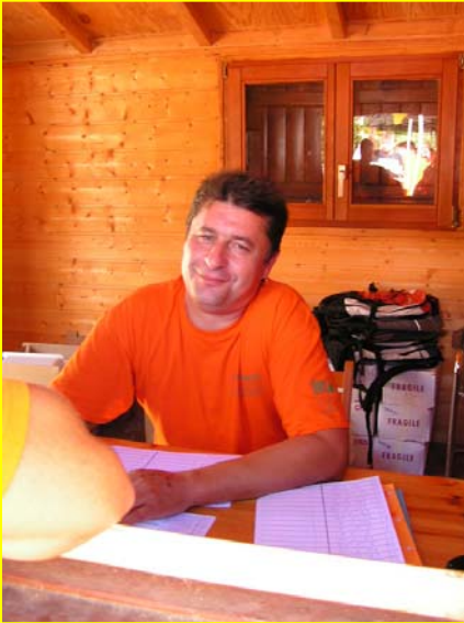
Mr le Directeur d'épreuve ...