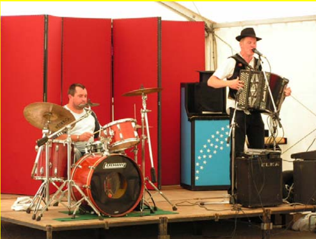
Avec son ami ...