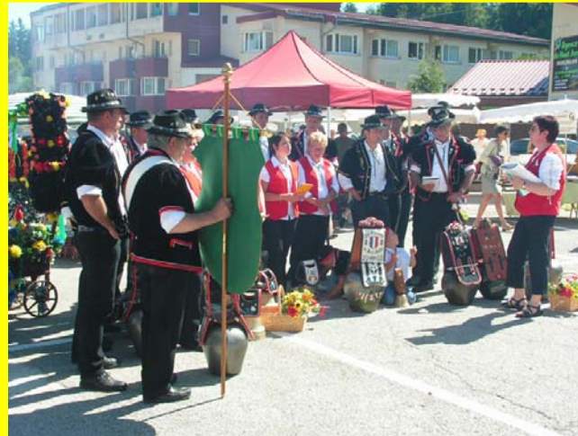
Dimanche, les Armailleurs du Ht Doubs ...